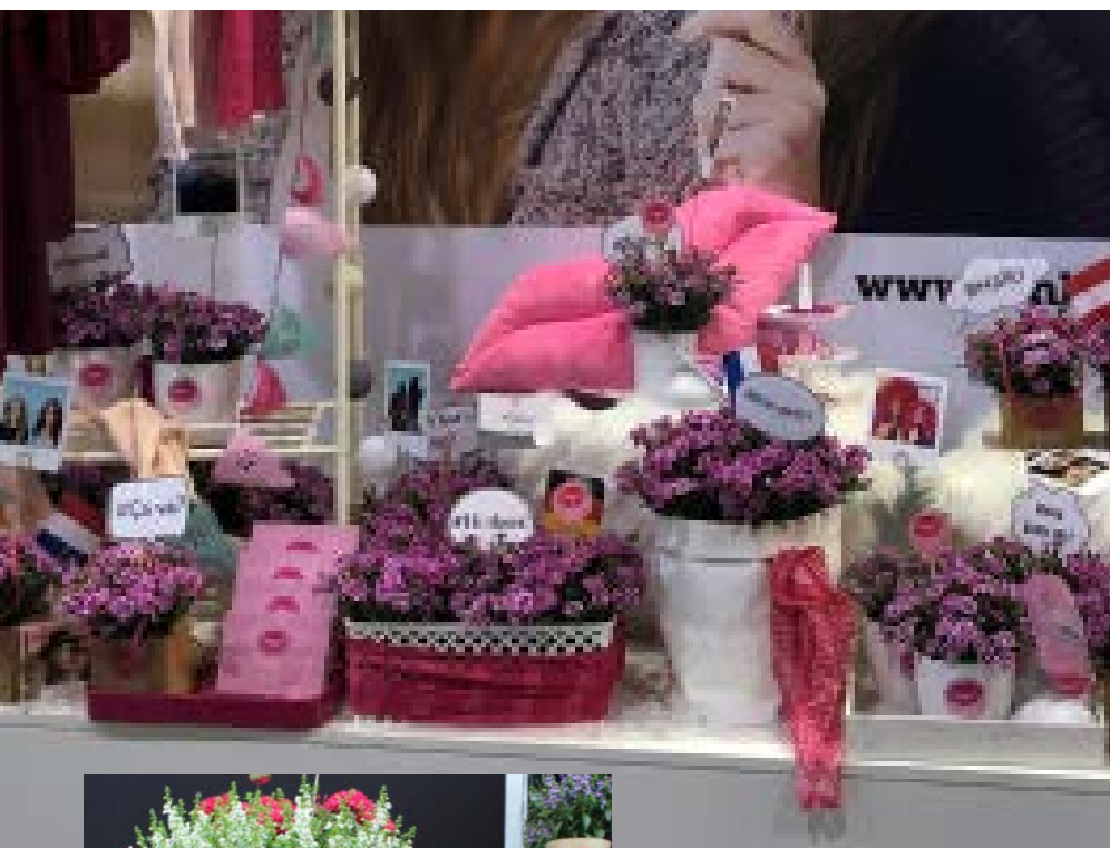
oben: Die Mininelke „Pink Kisses“ von Selecta one, Stuttgart, gehört zu den wohl erfolgreichsten und bekanntesten Pflanzenmarken der letzten Jahre.